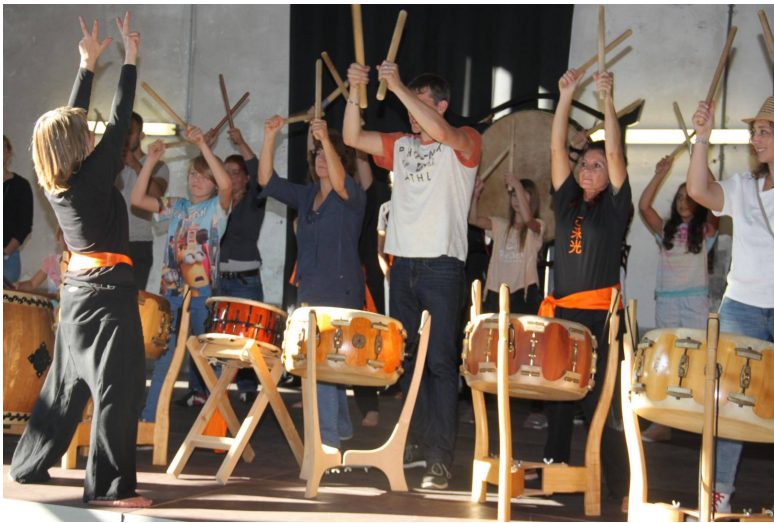
Trommel-Workshop im japanischen Stil.

Das Motto des rund achtzig Mitglieder starken Vereins lautet: «Gemeinsam kulturelle Brücken bauen, Faszinierendes erleben und zu <Grosser Harmonie> unter allen Menschen beitragen.» Rund ein Viertel der Mitglieder sind in der Schweiz lebende Menschen mit japanischen Wurzeln. Die weiteren Vereinsangehörigen fühlen von der vielfältigen japanischen Kultur angesprochen.