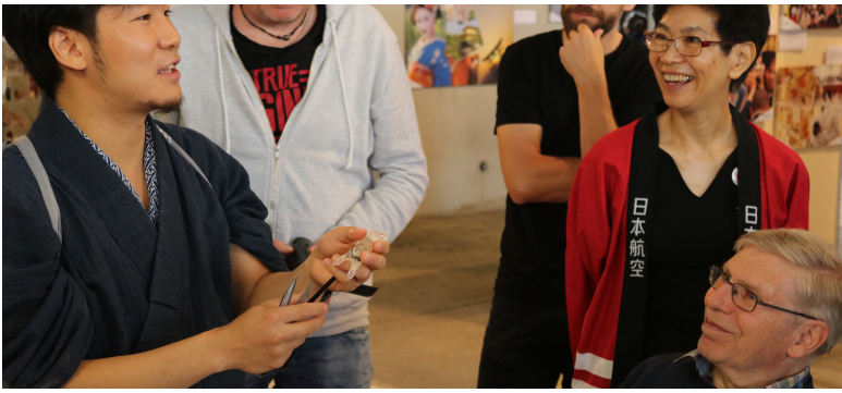
Gestaltung von Zuckerfiguren ein.